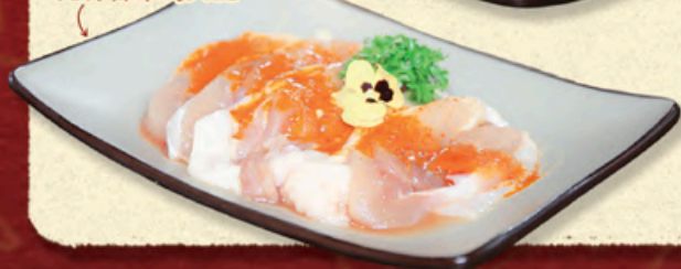
ĐŨI GÀ THẢO MỘC Herb Chicken Legs 无骨香草鸡大腿