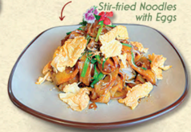
蛋炒河粉 HỦ TIẾU XÀO TRỨNG Stir-fried Noodles with Eggs