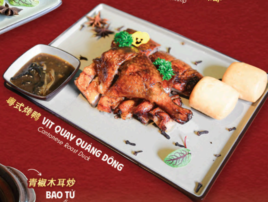
QUỐC 式 烤 鴨 VIT QUAY QUẢNG ĐÔNG Cantonese Roast Duck