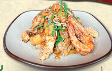
HỦ TIẾU XÀO HẢI SẢN Stir-fried Noodles with Seafood 海鲜炒河粉