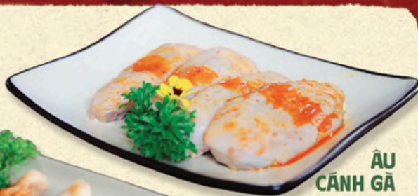
ÂU CẢNH GÀ Chicken Wings 鸡翅