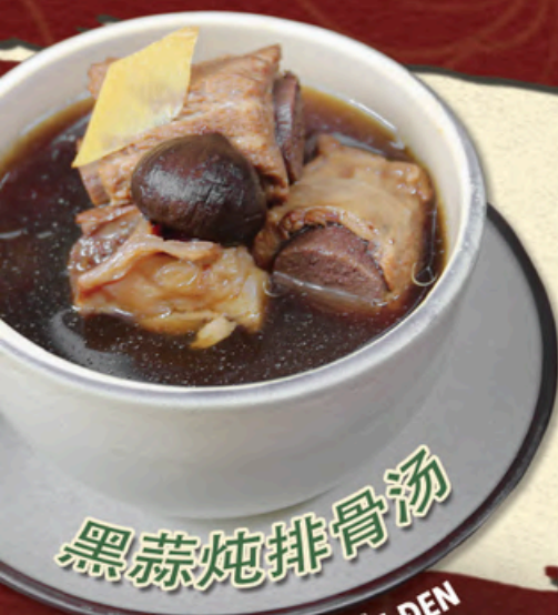
CANH SUÔN HÂM TỎI ĐEN Black Garlic Pork Ribs Soup