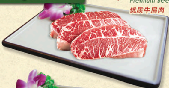
LỖI NẠC VAI BÒ THƯỢNG HẠNG Premium Beef Neck Core 优质牛肩肉