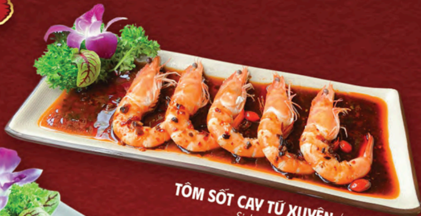
TÔM SỐT CAY TỬ XUYÊN / 川辣虾 Sichuan Spicy Shrimp