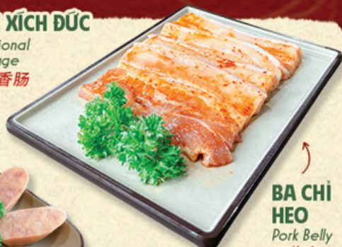
BA CHỈ HEO Pork Belly 五花肉