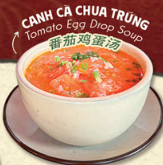
CANH CÀ CHUA TRỨNG Tomato Egg Drop Soup 番茄鸡蛋汤