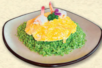
CƠM CHIÊN NGỌC BÍCH Hong Kong Jade Fried-rice 翡翠炒饭