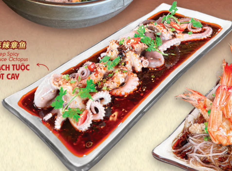
BACH TUỘC SỐT CAY TÊ