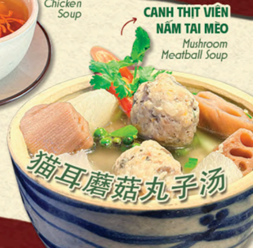
CANH THỊT VIÊN NẤM TAI MÈO Mushroom Meatball Soup