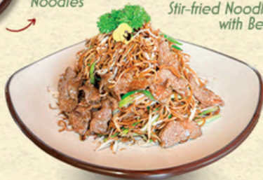
牛肉炒面 MỠ XÀO BÒ Stir-fried Noodles with Beef