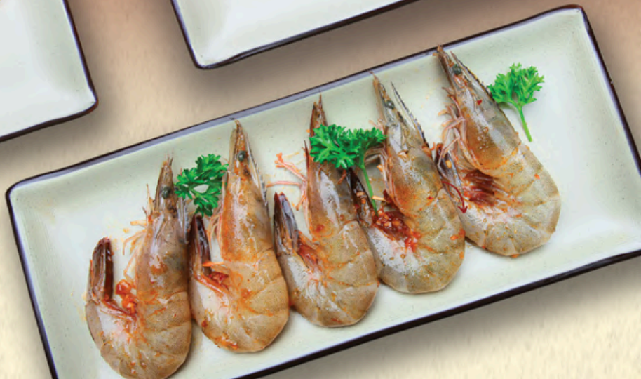
TÔM Shrimp 海虾