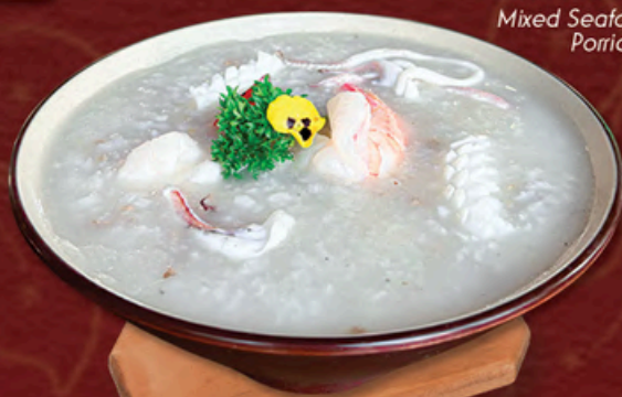
海鲜粥 CHÁO HẢI SẢN Mixed Seafood Porridge