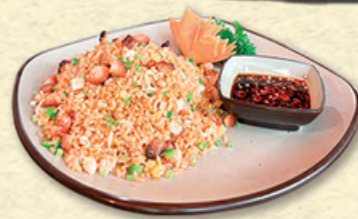
CƠM CHIÊN DƯƠNG CHÂU Yangzhou Fried-rice 扬州炒饭