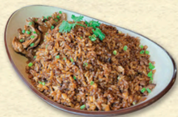
CƠM CHIÊN BÒ BĂM Minced Beef Fried-rice 牛肉末炒饭