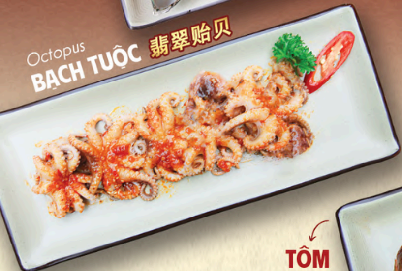
Gỏi thả ga ăn cực đã