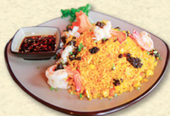
CƠM CHIÊN HẢI SẢN HẠT TÀU XÌ Douchi Fried-rice with Seafood 罗望子海鲜炒饭