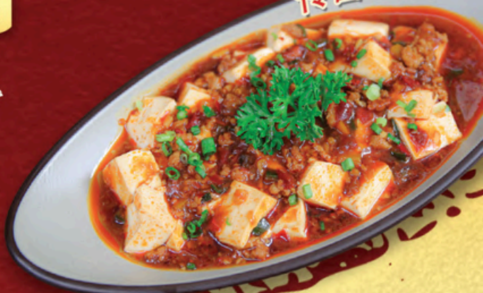
Đậu Phụ Tứ Xuyên Mapo Tofu