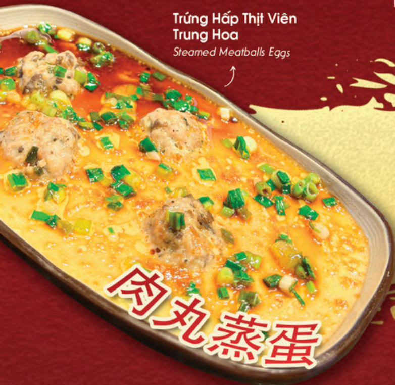
Trứng Hấp Thịt Viên Trung Hoa Steamed Meatballs Eggs