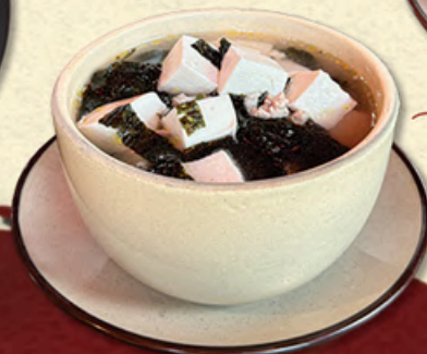
海带汤 CANH RONG BIỂN Seaweed Soup