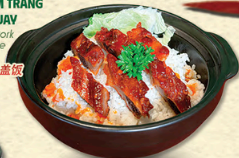
THỐ CƠM TRẮNG SUỐN QUAY Roasted Pork Ribs in Rice Bowl 烤排骨白盖饭