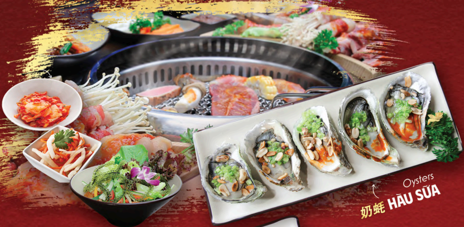
Oysters 奶蚝 HẦU SỮA