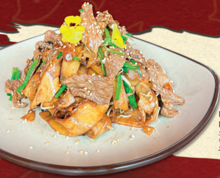
HỦ TIẾU HÒA DIÊM SƠN Stir-fried Noodles with Beef 火焰山炒牛河