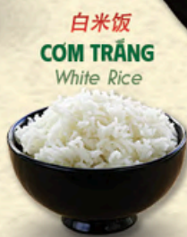
白米饭 CƠM TRẮNG White Rice