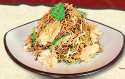
蛋炒面 MỠ TRỨNG XÀO Stir-fried Egg Noodles