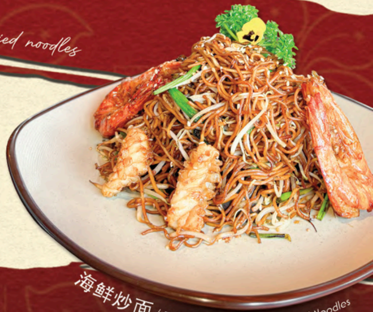
海鲜炒面 / MỠ XÀO HẢI SẢN Stir-fried Noodles with Seafood