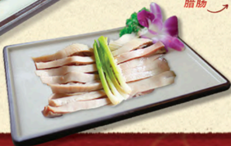
NÔNG HEO Pork Jowl 猪喉朥