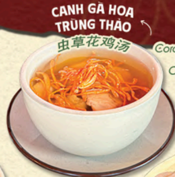
CANH GÀ HOA TRÙNG THẢO Cordyceps Flower Chicken Soup 虫草花鸡汤