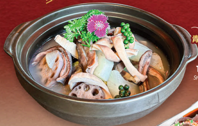
青椒木耳炒 BAO TỬ HEO HÂM TIÊU XANH Stewed Stomach Pepper