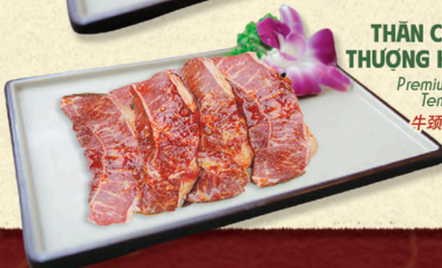
THÂN CỎ BÒ THƯỢNG HẠNG Premium Beef Tenderloin 牛颈里脊肉