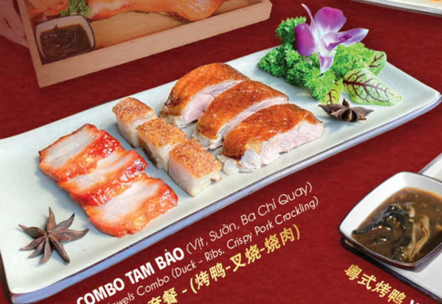
COMBO TAM BẢO (Vịt, Suôn, Ba Chi Quay) Triple Jewels Combo (Duck - Ribs, Crispy Pork Crackling) 三宝烧肉套餐 - (烤鸭-叉烧-烧肉)