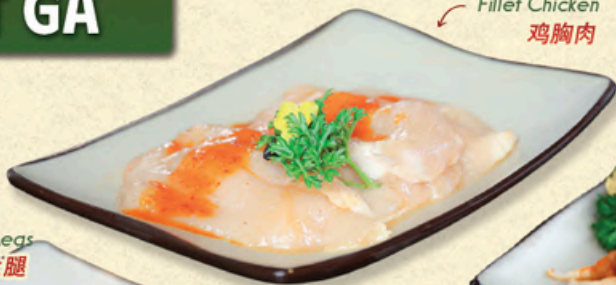
ỨNG GÀ PHI LÊ Fillet Chicken 鸡胸肉