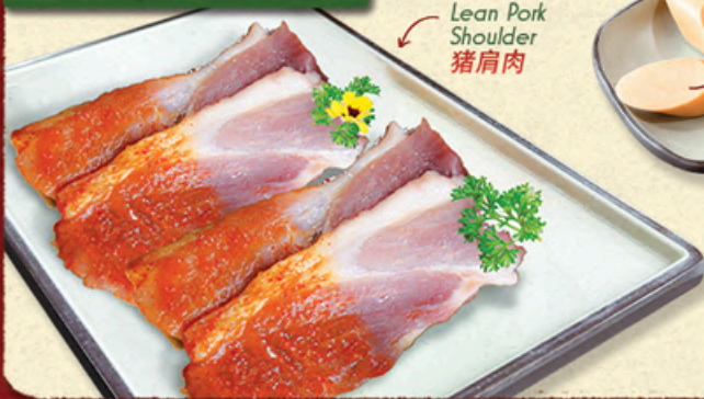
NẠC LÒI VAI HEO Lean Pork Shoulder 猪肩肉