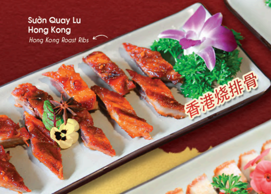
Sườn Quay Lu Hong Kong Hong Kong Roast Ribs