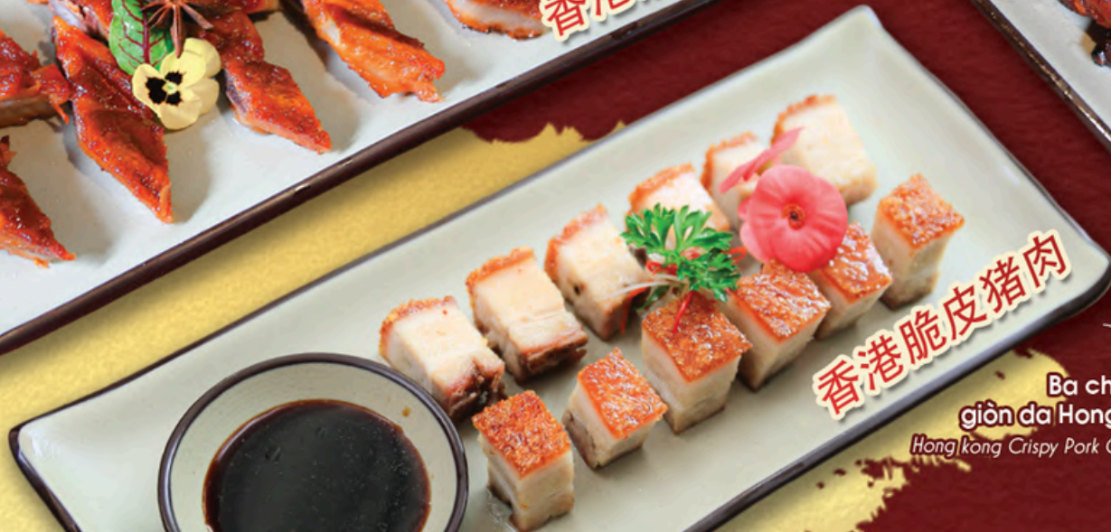
Ba chỉ quay giòn da Hong Kong Hong Kong Crispy Pork Cracking