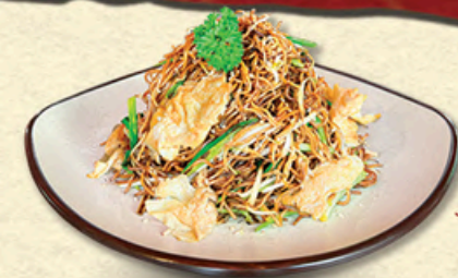
蛋炒面 MỠ TRỨNG XÀO Stir-fried Egg Noodles