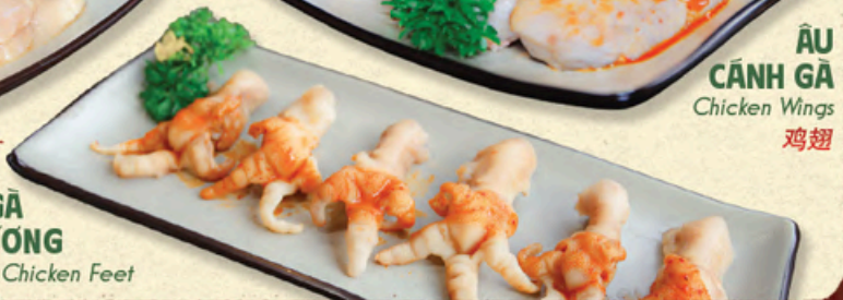
ÂU CẢNH GÀ Chicken Wings 鸡翅