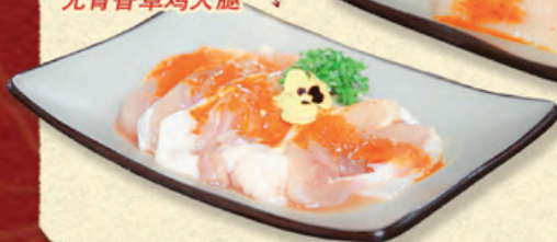
ĐŨI GÀ THẢO MỘC Herb Chicken Legs 无骨香草鸡大腿