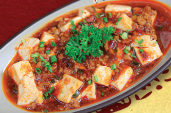
Đậu Phụ Tứ Xuyên Mapo Tofu