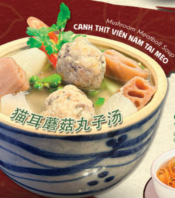
Mushroom Meatball Soup CANH THỊT VIÊN NẤM TAI MÈO