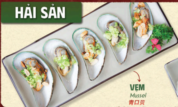
VEM Mussel 青口贝