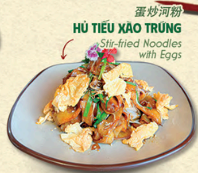
蛋炒河粉 HỦ TIẾU XÀO TRỨNG Stir-fried Noodles with Eggs