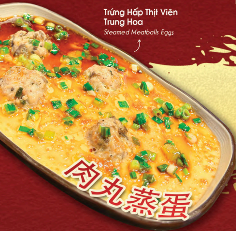
Trứng Hấp Thịt Viên Trung Hoa Steamed Meatballs Eggs