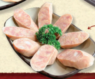
LẠP XƯỚNG CỎ GÀI TÌM TRUNG HOA 腊肠 Hong Kong Sausage