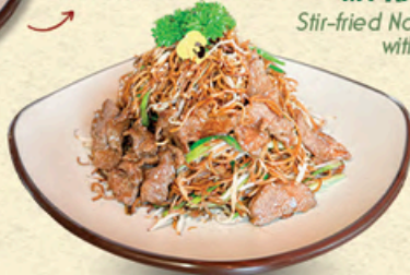
牛肉炒面 MỠ XÀO BÒ Stir-fried Noodles with Beef