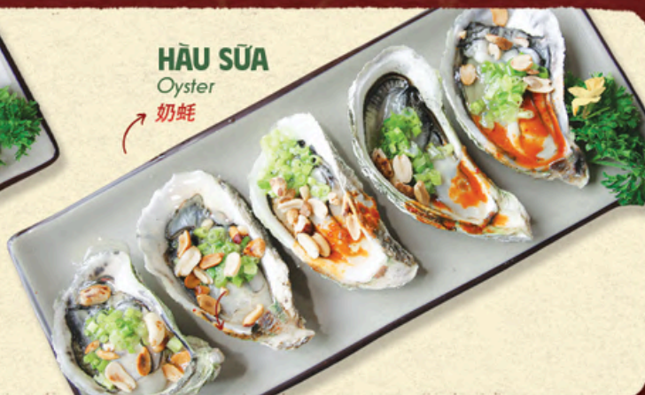
HẦU SỮA Oyster 奶蚝