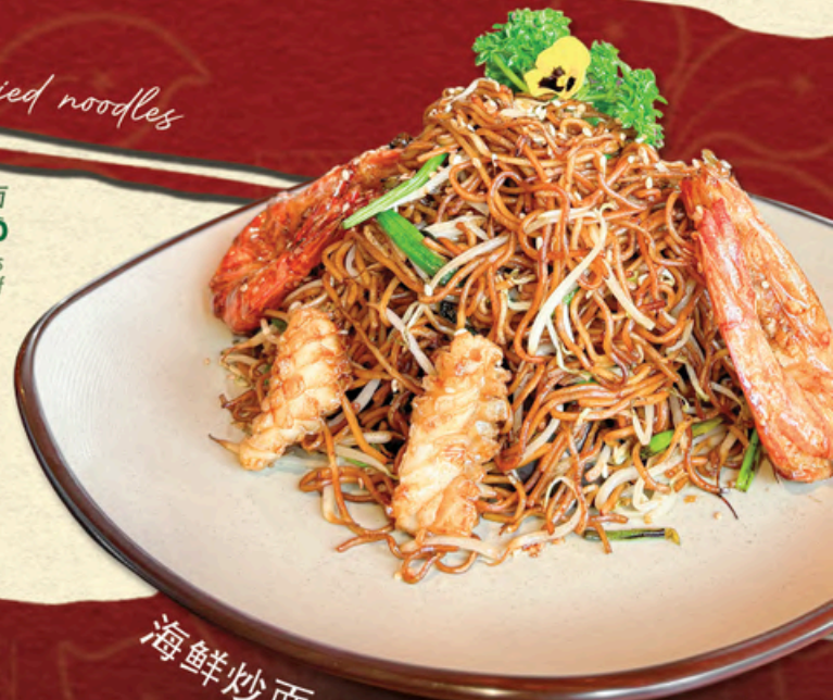
海鲜炒面 / MỠ XÀO HẢI SẢN Stir-fried Noodles with Seafood