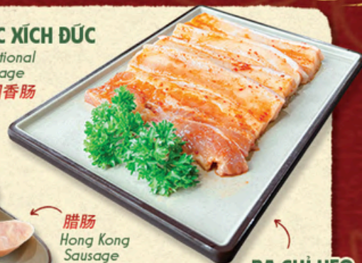
BA CHỈ HEO Pork Belly 五花肉