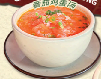
Tomato Egg Drop Soup CANH CÀ CHUA TRỨNG 番茄鸡蛋汤