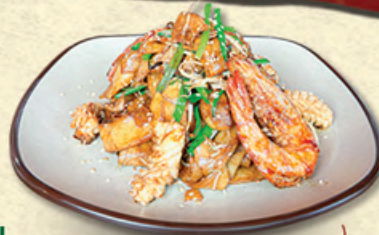
HỦ TIẾU XÀO HẢI SẢN Stir-fried Noodles with Seafood 海鲜炒河粉