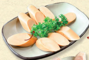
XÚC XÍCH ĐỨC Traditional Sausage 德国香肠