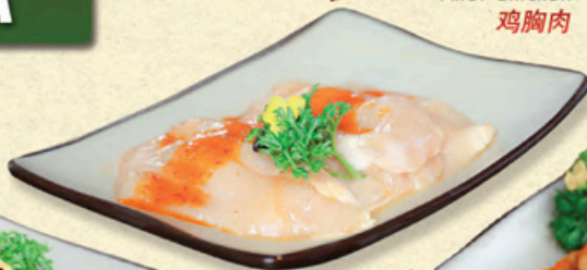
ỨC GÀ PHI LÊ Fillet Chicken 鸡胸肉